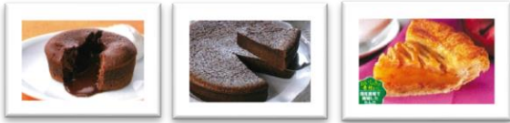
フォンダンショコラ クラシックショコラ アップルパイ