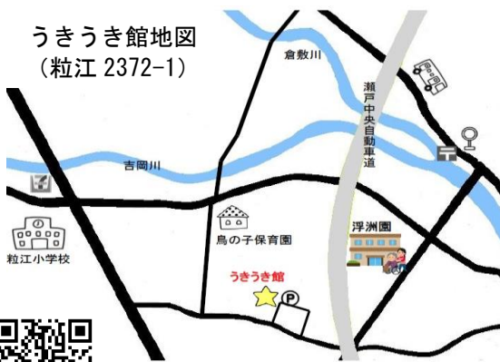
うきうき館地図 (粒江 2372-1)